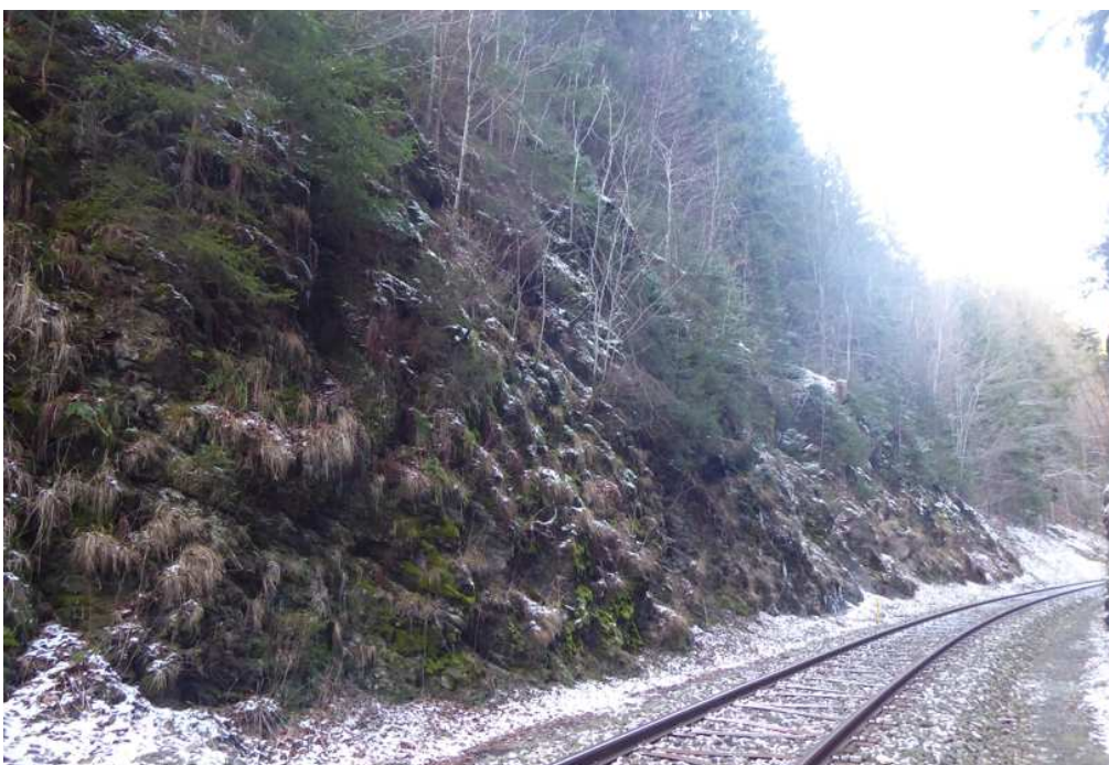
Celkový pohled na levou část zářezu. Po odstranění vegetace, odtěžení a očištění bude zajištěna ocel. sítí 80 x 100 mm, částečně doplněnou o protierozní extrudovanou georohož. Akumulační prostor v patě svahu bude vyčištěn od napadané horniny. Stávající vedení IS bude zachováno.