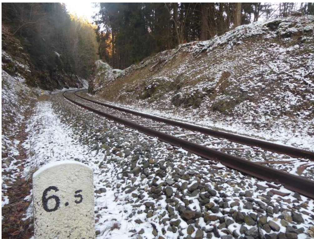
Pravá část zářezu na začátku úseku. Po odstranění vegetace a očištění bude zajištěna ocel. sítí 80 x 100 mm, doplněnou o protierozní extrud. georohož.